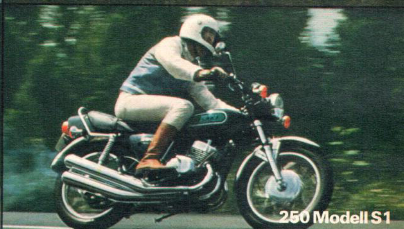
250 Modell S1