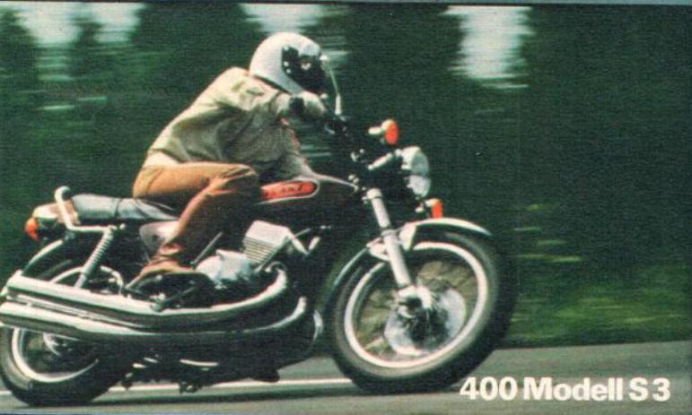
400 Modell S3