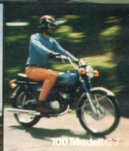
100 Modell G7