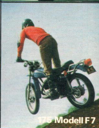
175 Modell F7