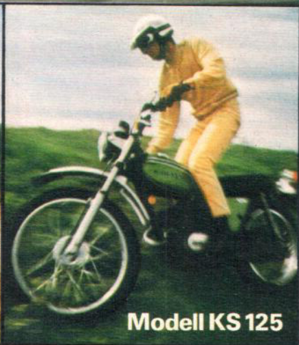
Modell KS 125