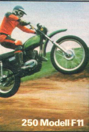
250 Modell F11