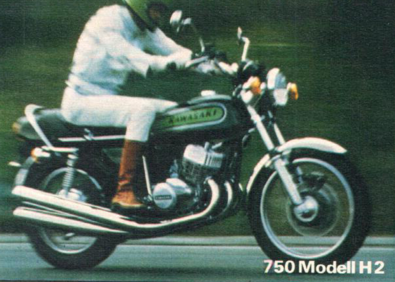
750 Modell H2