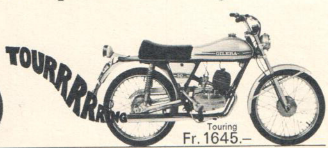
Touring Fr. 1645.-

Hier ist Dynamik und Kraft mit vollendetem italienischem Styling verbunden. Gilera Touring und Gilera Trial – zwei neue, aussergewöhnliche 50-cm 3 -Maschinen: Mit Doppelrohrrahmen. Mit radial verripptem Zylinder- kopf. Mit hydraulisch gedämpfter «Ceriani»-Telegabel. Mit vielen exklusiven Details.