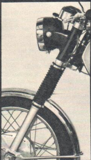
Telegabel mit langem Federweg. Für Fahrkomfort und Sicherheit.