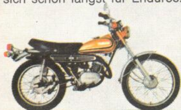
YAMAHA-ENDURO DT 125 E.

Wenn herkömmliche Maschinen bereits aufgeben, zeigen YAMAHA-ENDUROS was wirklich in ihnen steckt. — Wo Autobahnen und Straßen enden, sind sie noch lange nicht am Ende. — Sehen Sie sich bei unseren Nachbarn um: Die Mehrzahl der Motorradkäufer in Frankreich, Holland, Belgien und der Schweiz entscheiden sich schon längst für Enduros.