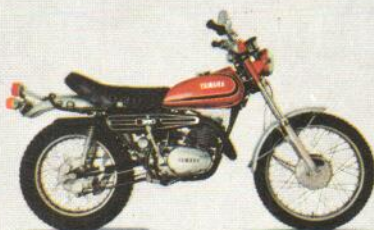
DT 360 — Die größte und kräftigste ENDURO. Von YAMAHA.

— ENDUROS von YAMAHA. So heißt die neue realistische Motorrad-Generation. Problemlos. Robust. Wartungsarm. Wie z.B. die YAMAHA ENDURO DT 250: