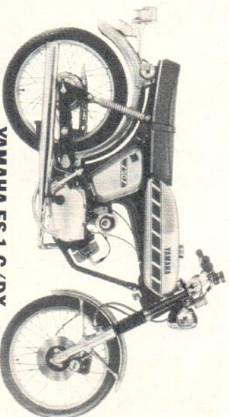
YAMAHA FS 1-G/DX

Schon mit 50 ccm ein „ausgewachsenes“ Motorrad. Im Look, Und vor allem technisch gesehen: 1-Zyl.-2-Takt-Motor, Getrenntschmierung, 6,26 DIN-PS bei 8325 U./min, 5 Gänge, Scheibenbremse vorn, Ca. 85 km/h. DM 2.300,-* (Führerscheinklasse 4) Mokick RD 50 M, DM 1.952,-* (Führerscheinklasse 5)