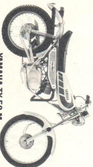
YAMAHA TY 50 M

Gebaut nach der YAMAHA-Komplett-Formel. – Z.B. Blinkanlage serienmäßig. Jetzt neu mit ALJOLUBE-Getrenntschmierung. – 1-Zyl.-2-Takt-Motor, 2,8 DIN-PS bei 5400 U./min, 4 Gänge, Scheibenbremse vorn, 40 km/h. DM 1.845,-* (Führerscheinklasse 5)