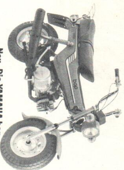
Neu. Die YAMAHA bop.

Grünstraße 44, 4005 Meerbusch 1, Telefon (0 21 05) 5892