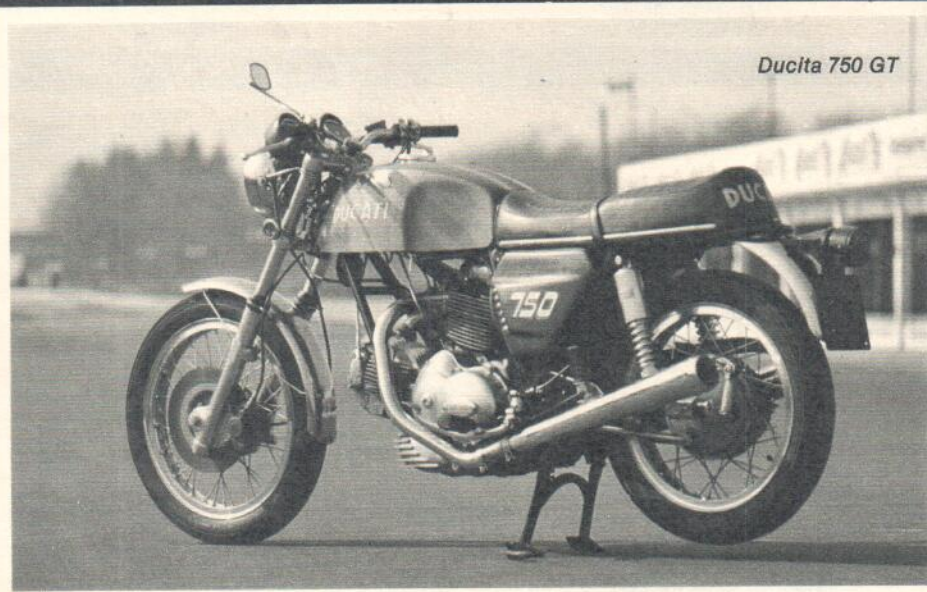
Ducita 750 GT

Schon in unserem Vorbericht wiesen wir darauf hin, daß die derzeit gefertigten DKW-Modelle bei Hercules in Nürnberg über die gleichen Bänder laufen und sich auch in der Konzeption aus Rationalisierungsgründen weitgehend gleichen. Deshalb setzt sich das heutige DKW-Programm – abgesehen von den ebenfalls im letzten Heft bereits erwähnten Spezial-Geländemodellen für den USA-Markt – aus zwei 50 ccm-Modellen und einem 125er Modell zusammen. Der Typ RT 159 Jet ist mit dem 5,8 PS leistenden F & S-Motor mit 50 ccm ausgerüstet, der Typ RT 159 ES hat den 6,25er Motor mit dem Leichtmetall-Breitwandzylinder und Fächerkopf sowie der kontaktlosen Motoplatzzündung. Hier findet im Gegensatz zur Teleskopgabel der Jet eine Langarmschwinge vorn Verwendung. Mit Motoplatzzündung und Teleskopgabel wartet auch die RT 125 E (jetzt 17 PS) auf.