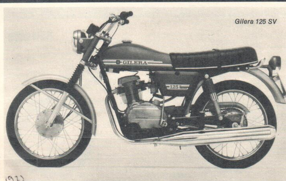
Gilera 125 SV

Keine andere Fabrik hat die Ventilsteuerung mittels „Königswelle“ so zu einem Image ihrer Erzeugnisse gemacht wie Ducati. Sozusagen eine Supersport-Motorradfabrik. Die Motoren sind nicht nur leistungsfähig und gut, sondern auch schöne Konstruktionen. Mit der desmodromischen Ventilsteuerung begibt man einen weiteren Weg, unter den Motorradfahrern viele Freunde zu gewinnen. Nachdem nun die Zweizylinder-Maschine GT als Tourenmodell und S als Sportmodell auf dem Markt erschienen sind, jubeln die Ducati-Enthusiasten um so mehr. Auch diese Motoren haben Königswellen als Ventilsteuerung. Ein Nürburgring-Test des MOTORRAD ergab mit der Tourenmaschine GT sehr gute Fahrleistungen und das Fluidum des ganz Besonderen. Der Sieg beim Formelrennen in Imola 1972 mit der „S“-Formelversion war eine Überraschung und sicherte dem Werk Käuferinteressen.