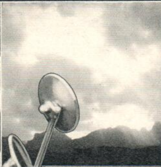
Vibrationsfreie in Gummi aufgehängte Instrumente