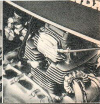
2 Zylinder 4-Takt-Motor 124 ccm. 12 DIN/PS 5-Gang-Getriebe Fußschaltung. 110 km/h Elektrischer Anlasser Scheibenbremse