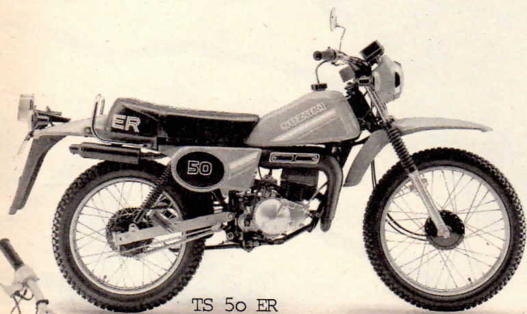
TS 50 ER