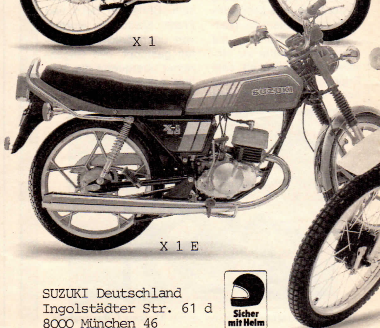
X 1 E