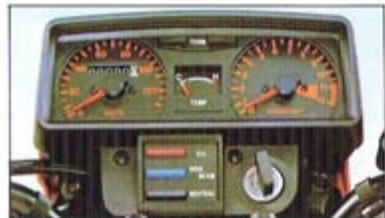
Panel de instrumentos compacto y de alta visibilidad

Accesorios opcionales: RETROVISOR DERECHO. PORTA EQUIPAJES. CARENADO AERODINAMICO INFERIOR