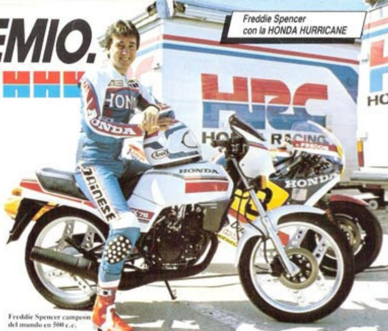
Freddie Spencer campeón del mundo en 500 c.c.

Sólo consume 2.2 L./100 Kms. a la velocidad de 50 Kms./h.