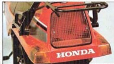
Intermitentes traseros y portaequipajes (opcional)